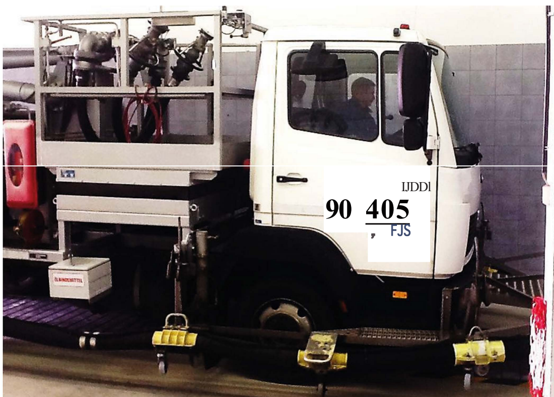
Imagem 1: Detalhe do caminhão tanque nº 90 405

O caminhão tanque opera no apron do aeroporto de Frankfurt, abastecendo os aviões. Lá o caminhão é usado na maior parte em viagens de curto alcance. O motor gira durante o abastecimento do avião em altas rotações, sendo submetido assim a um desgaste maior. Um horímetro não está instalado, e os quilômetros do hodômetro não correspondem as horas de serviço. Os altos giros são necessários para bombear o querosene das tubulações subterrâneas através do seu sistema de bombeamento até o avião, com até 3.000 ltr./minuto.