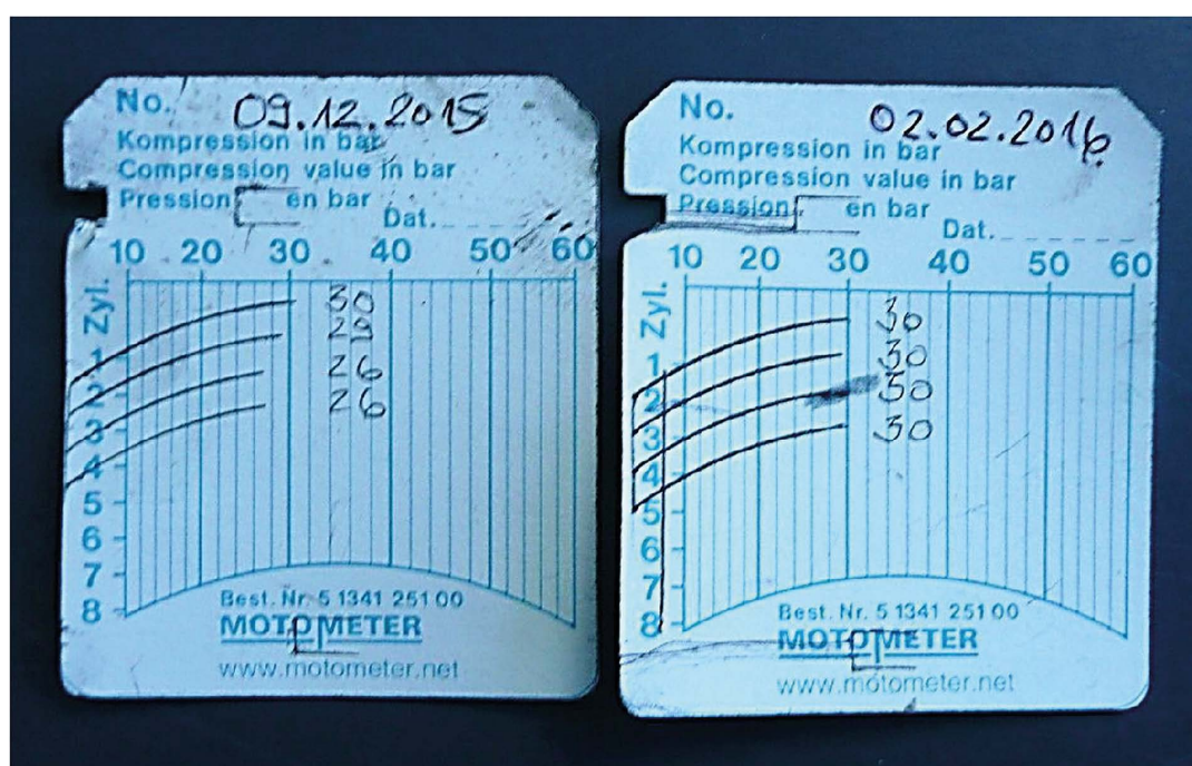
Imagem 3: Folhas de gráficos da compressão antes e depois em comparação direta

Em 02.02.2016 efetuou-se em condições iguais ao do dia 09.12.2015 uma nova medição da compressão. Entre estas datas o veículo estava trabalhando normalmente.