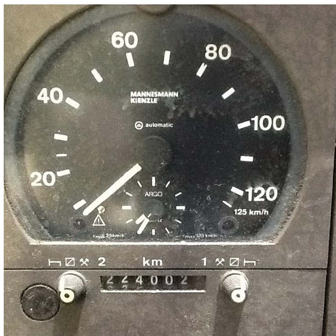
Imagem 4: Tacógrafo antes do tratamento

Seguem algumas imagens tiradas durante da aplicação.